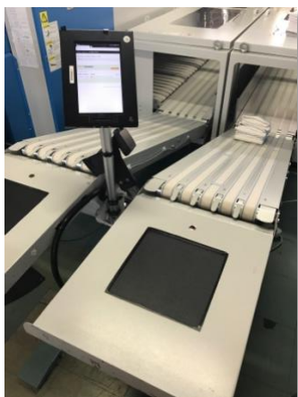
- Table Pliage RFID avec antenne intégrée au poste -

Pour répondre à cette problématique, Coppernic a mis en place des solutions variées s'adaptant parfaitement à l'environnement tout au long du processus de blanchisserie.